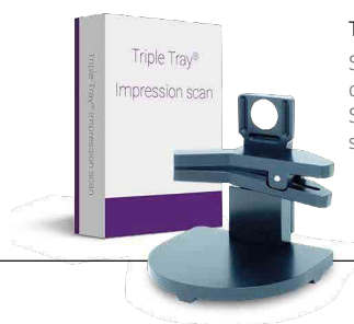
Triple Tray Supporto per scansione dell'impronta Support for impression scanning

For private practitioners, there are no rules that dictate the terms of preservation of clinical documentation, but it is advised to keep it for 10 years. It is recommended to report any alteration, loss, theft or destruction of the material. Any posthumous destruction shall take place in compliance with Legislative Decree 196/2003. Archiving orthodontic models has always been difficult for dentists, as it requires the physical conservation of the product. Thanks to a special support, Tecno Scan allows the scanning of orthodontic models and the subsequent storage of product files, eliminating any physical storing activity.